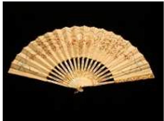
Eventail de Marie-Antoinette, 2006 dans le film de Sofia Coppola « Marie-Antoinette »