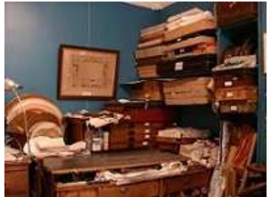
L'atelier d'Anne Hoguet