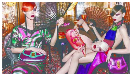
Collection Louis Vuitton, Octobre 2010